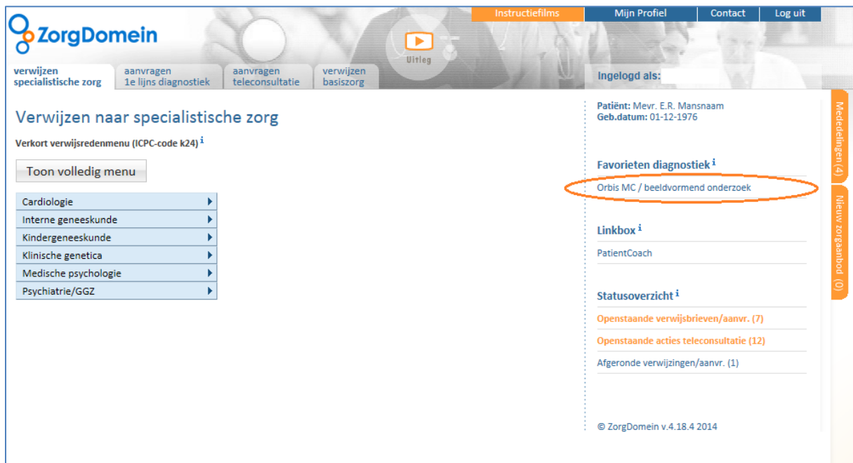
Figuur 1: Favoriet 'Orbis MC / Beeldvormend onderzoek' waarmee u in één klik terechtkomt in het aanvraagformulier van Orbis MC

ZorgDomein heeft alvast één favoriet voor u aangemaakt waarmee u met één klik terecht komt in het aanvraagformulier van Orbis. Deze favoriet vindt u rechts in het startscherm van ZorgDomein, zie figuur 1.