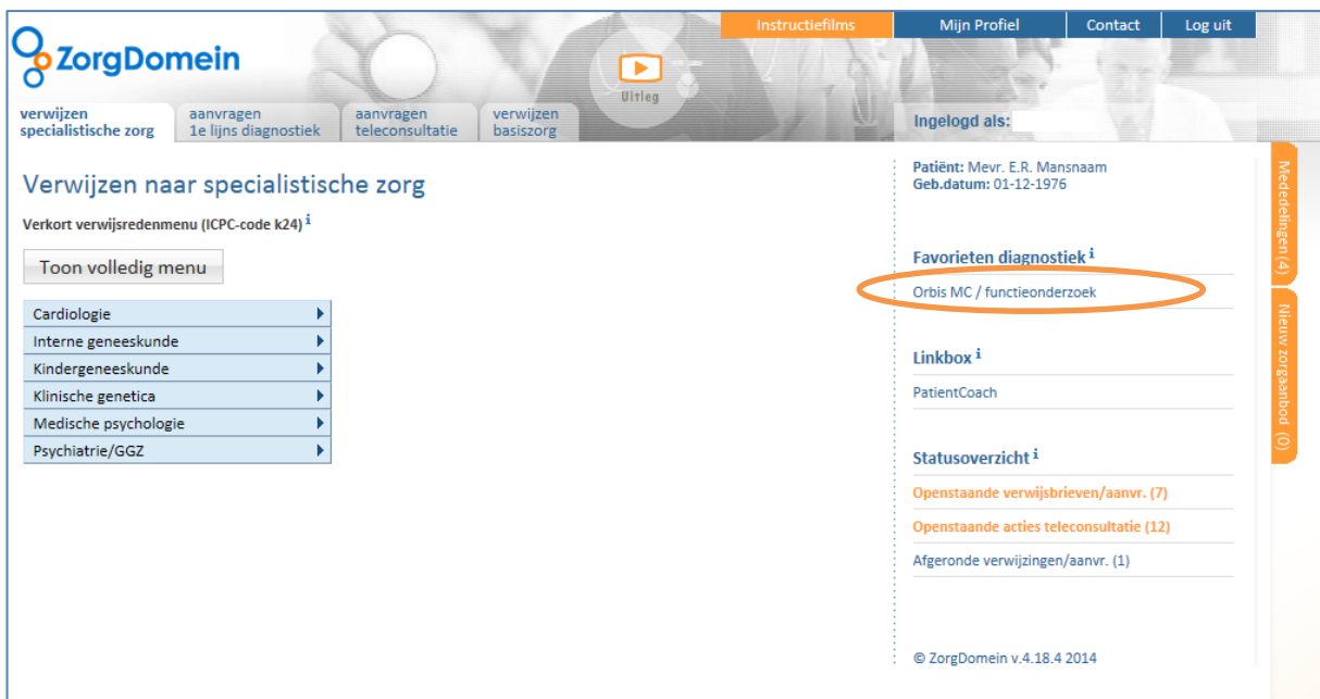
Figuur 5: De favoriete aanvraag verschijnt onder het kopje 'Favorieten diagnostiek' rechts in het snelkeuzemenu