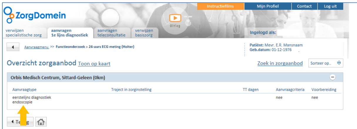
Figuur 2: Selecteer het betreffende aanbod van Orbis Medisch Centrum dat u wilt toevoegen aan uw favorieten