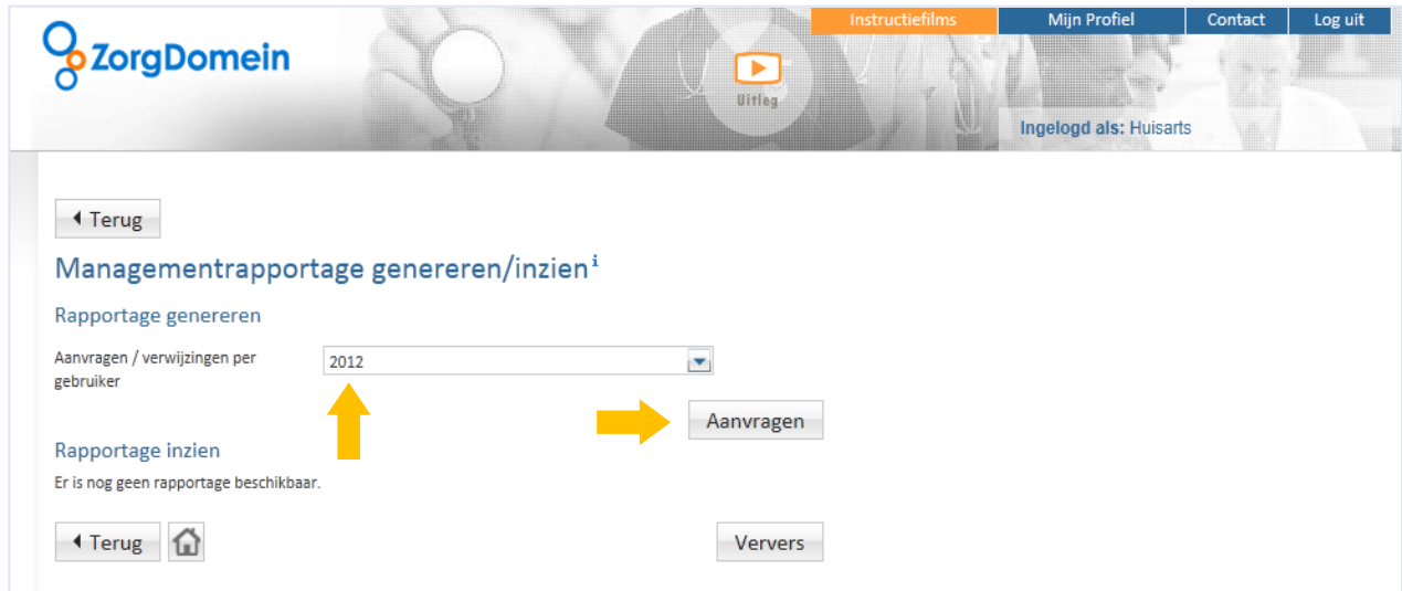
Figuur 3: Selecteer het gewenste jaartal en klik op de knop 'Aanvragen'