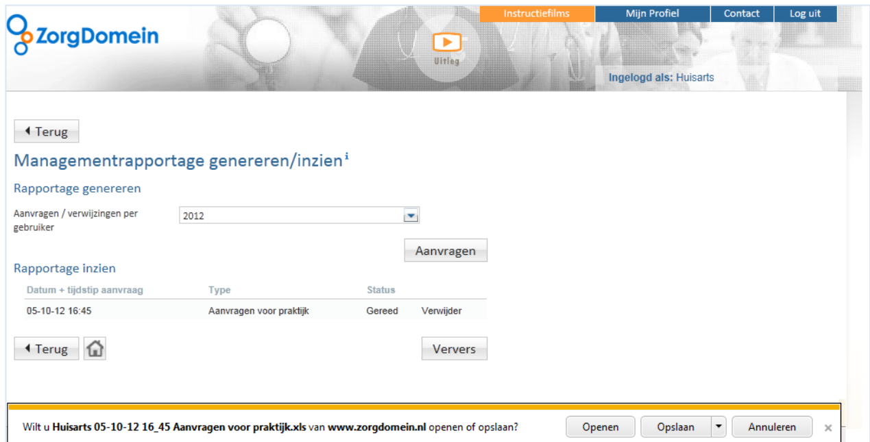
Figuur 4: Kies of het bestand wordt opgeslagen of geopend