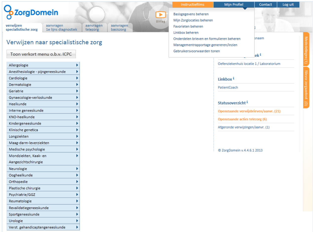
Figuur 1: het uitklapmenu 'Mijn Profiel'

Binnen ZorgDomein is het mogelijk diverse persoonlijke voorkeuren en instellingen vast te leggen, te beheren en managementrapportages te genereren. Dit kan onder het uitklapmenu 'Mijn Profiel' rechts bovenin het startscherm van ZorgDomein (zie figuur 1).