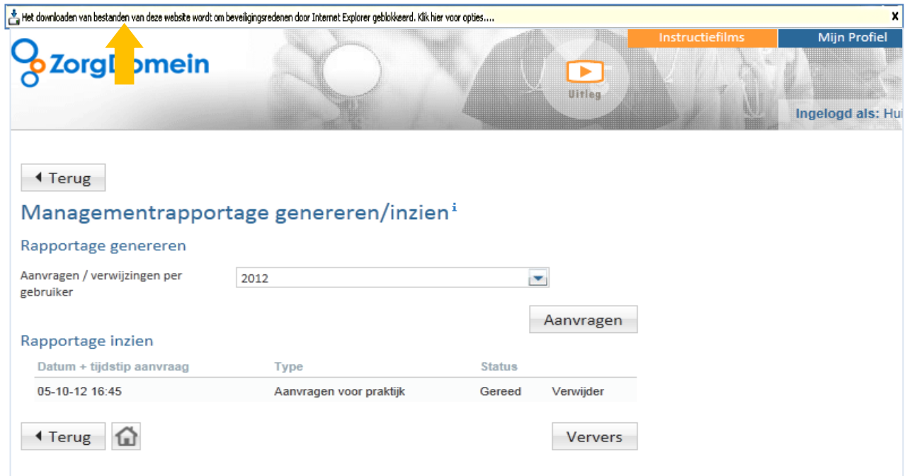
Figuur 5: klik op de balk om het downloaden te starten

Indien het programma 'Windows Internet Explorer' uw standaardbrowser is, kan het downloaden van bestanden om beveiligingsredenen worden geblokkeerd (zie figuur 5). Klik deze balk aan en geef aan dat u het bestand wilt downloaden, sla het bestand op en open het bestand in het programma 'Microsoft Excel'.